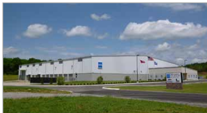
米国テネシー州にある MEIWA INDUSTRY NORTH AMERICA, INC.

盟和産業様が 2012 年に某携帯電話会社の iOS 端末を導入した当初は、iPhone 構成ユーティリティを使って端末の管理を行っ